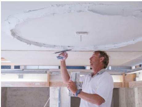
Of echte kunstwerken