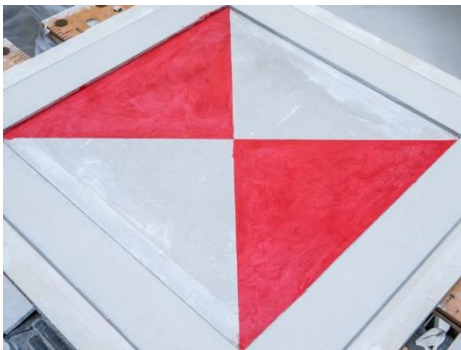
Met speciale technieken